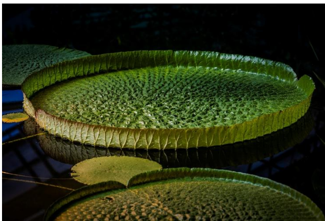
Bernd Kasper: Seerose