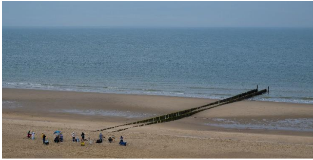
Bernd Kasper: Standmaler