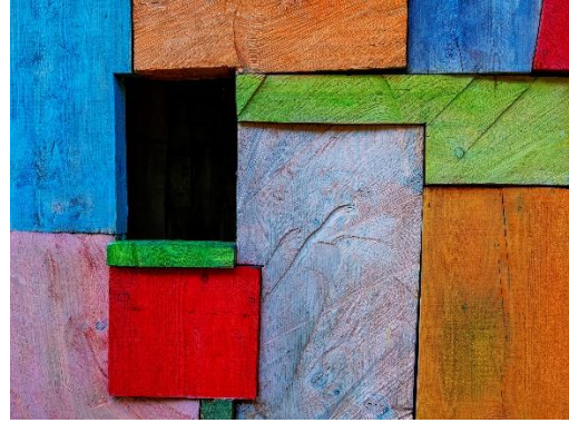
Wolfgang Linker: Farbiges Holz